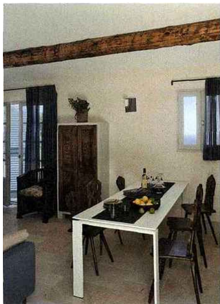
Design et tradition. La table Kartell est encadrée de chaises anciennes, et des volets provençaux se sont mués en portes de placard.