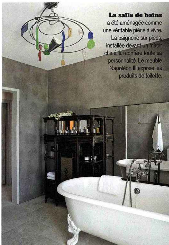
La salle de bains a été aménagée comme une véritable pièce à vivre. La baignoire sur pieds, installée devant un miroir chiné, lui confère toute sa personnalité. Le meuble Napoléon III expose les produits de toilette.