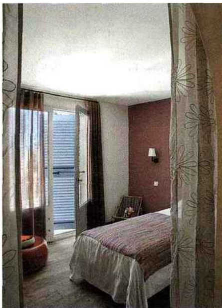
Dans la chambre aux murs chaulés, seul un côté est peint de couleur aubergine pour donner de la profondeur.