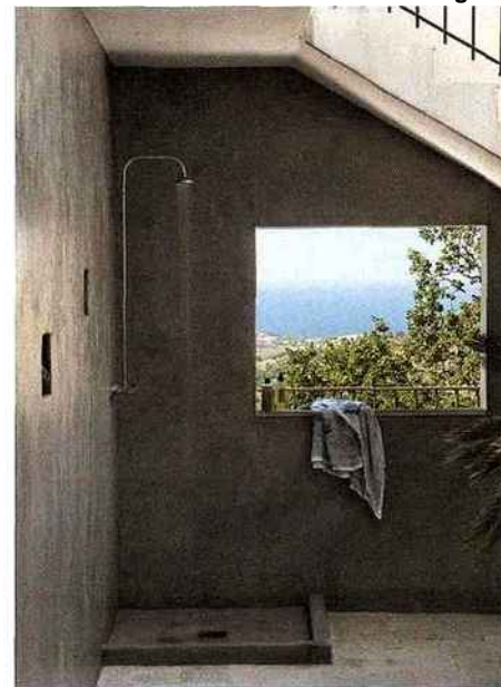
Douche en plein air. Une ouverture a été créée dans une paroi de la douche pour profiter au maximum de la vue sur mer.